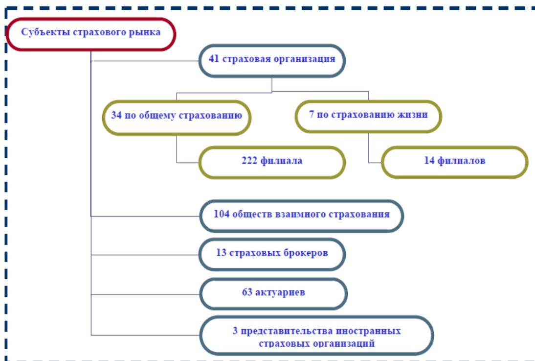
Сурет 2 – Сақтандыру секторының институционалдық секторы