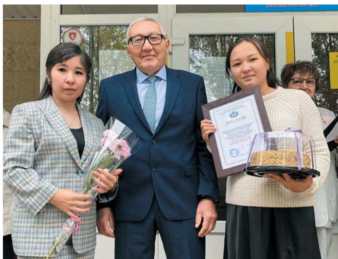
2023 жылдың 1 қыркүйегінде А.Қ. Құсайынов атындағы Еуразия гуманитарлық институтында білім күніне арналған жиын өтті.